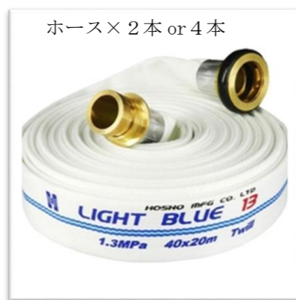
ホース×2本 or 4本