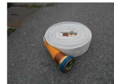
主に、放水に使用したホースを撤収する際の巻き方