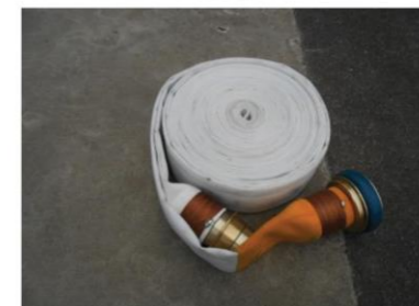
ホースの基本的な巻き方