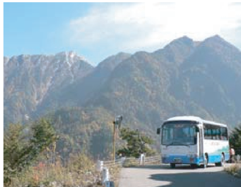
林道バスと東(甲斐)駒ヶ岳