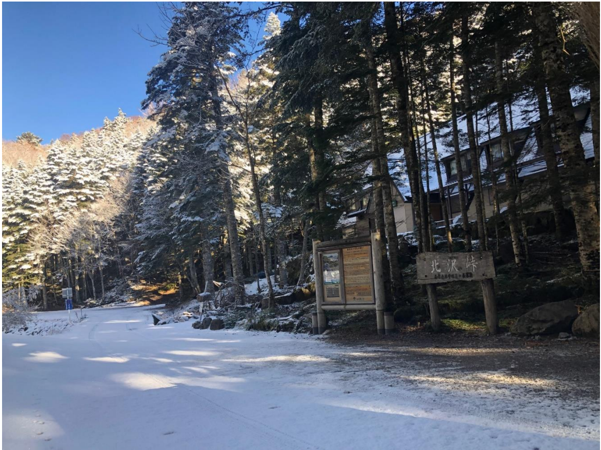
北沢峠付近の状況