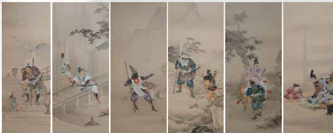
①池上秀畝《鶴松図》1938年 絹本金地着色 六曲一双屏風 ②池上秀畝《清塘奇遇》1927年 絹本着色 軸装 第8回帝展出品作 ③池上秀畝《武者図》制作年不詳 絹本着色 六曲屏風 ④写真：画室の池上秀畝