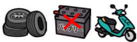
자동차 타이어, 오토바이 배터리, 자동차 부품