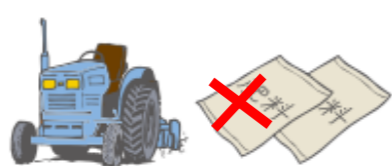
농기구, 농약 등