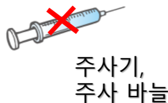
주사기, 주사 바늘