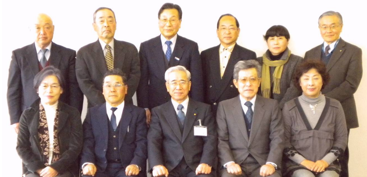
お世話になりました。今期、お務めいただいた伊那市社会教育委員の皆さんです。

一年目は耳なれない言葉で右往左往、二年目になってやっとおぼろげながらも道が出来、今やれることは何かを考え、興味を持ったイベントには積極的に参加してみようと実践しました。たくさんのお出会いがありとても貴重な体験をさせてもらうことが出来感謝しております。この体験（点）を線にそして地域社会（面）にとつなげていけたらと思います。お世話になりました。