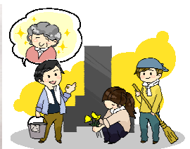
墓地清掃代行サービス