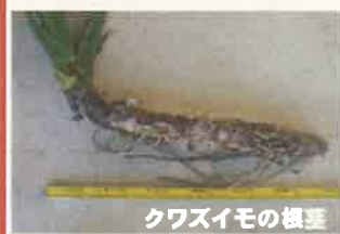
クワズイモの根茎