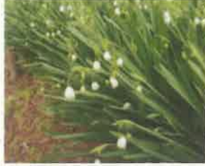
スノーフレーク (スズランスイセン)