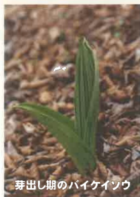
芽出し期のバイケイソウ