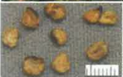
チョウセン アサガオの種