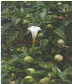
チョウセン アサガオの葉と花