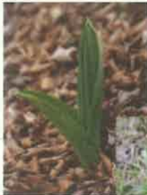
芽出し期の バイケイ ソウ