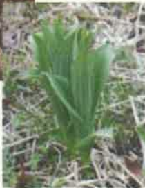
芽出し期 のコバイ ケイソウ