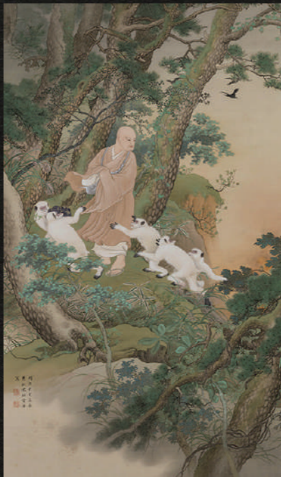
《日蓮上人避難之図》1911(明治44)年 絹本着色 (一財)北方文化博物館

第6回読画会出品作品。名越の小庵で読経を終えた日蓮の前に白猿が現れ、その猿に衣の袖を引かれて山中へ入っていく。そこで、小庵を振り返ると火炎が上がっているという、日蓮伝記中の、いわゆる松葉ヶ谷の法難と呼ばれる場面が描かれている。日蓮や白猿の姿態、表情や目線には物語を導く綿密な計算が施され、猿の白毛から樹木の葉一枚に至るまで濃密な描きこみがなされている。人物・動物表現における秀畝の筆力を十分に発揮した作品。