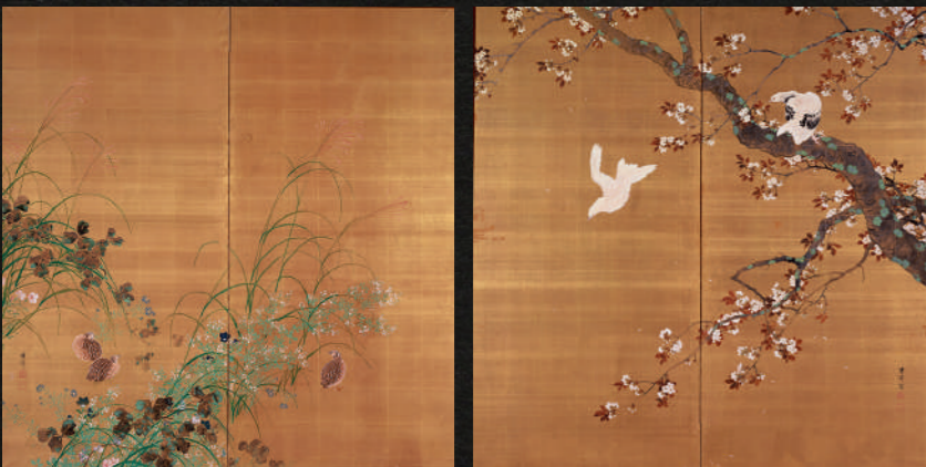
《桜花雙鳩・秋草群鶉図》1921(大正10)年 絹本金地着色 練馬区立美術館

絹本金地の煌びやかな画面に対角線構図で春と秋の花鳥が描かれている。桜の枝から飛び立っていく鳩に、一方は両足を踏ん張り獲物を見定めるかの如く首をもたげ、いずれも躍動的な描写である。これに呼応する左隻は可憐な草花が咲き、丸い鶉が転げるように配される。動と静、写実性と装飾性といった二項対立、異質感が一對にまとめ上げられている。