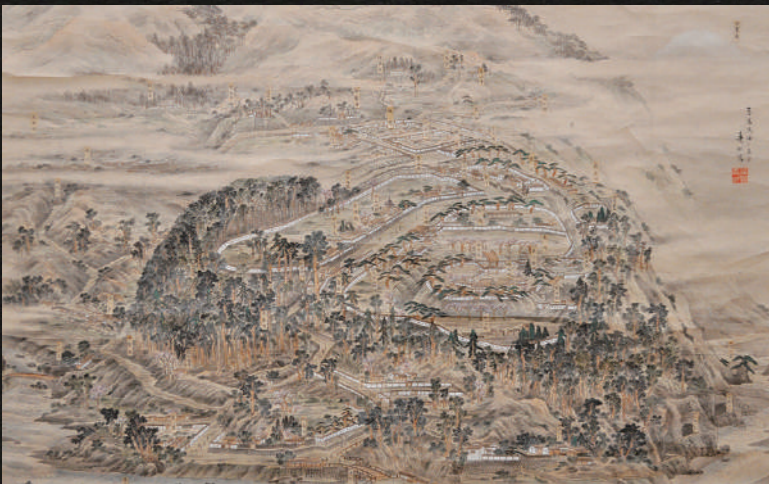
《旧高遠城之真景》明治20年代 紙本著色 高遠町歴史博物館

本作は西の方角から高遠城を眺めた構図の名所絵となっている。各曲輪の名称、周辺の寺社の名称、武家地の地名などが書き込まれている。また、当時あった建物、助助曲輪や笹曲輪にあった稲荷社も描かれており、高遠城の建物の研究材料にもなっている。高遠城は1872(明治5)年に廃城したため、本作は在りし日の姿を偲ぶ目的で描かれたものといえる。父・秀花がよく似た図を描いていることから、それを元図にしたと考えられている。