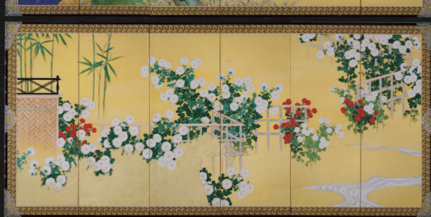
《国ノ華》1924(大正13)年 紙本金地着色 皇居三の丸尚蔵館

1924(大正13)年、皇太子(昭和天皇)の婚禮の祝いの品として、男爵藤田平太郎により秀畝に依頼、制作された。右隻に日本を表す桜の大きを、左隻に皇室を表す菊の花を、紅白咲き乱れる様子が描かれる。桜や菊の花びらは、胡粉を盛り上げて彩色をほどこし、立体感ある力強さで、金地に負けない存在感を放つ。左隻には豊かに咲く菊の花に竹垣が配され、右端には細い流水が流れる。