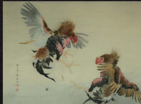
《決闘》1943(昭和18)年 絹本着色 信州高遠美術館

練馬区立美術館では2024年3/16～4/21、長野県立美術館で5/25～6/30に展示予定