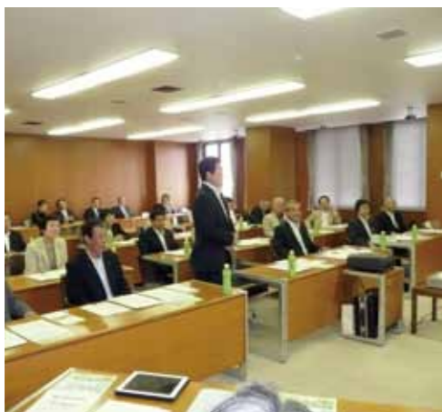
知立市訪問の様子

伊那市議会では、姉妹都市・友好都市との間で、定期的に双方の市を訪問し合い、交流事業を行ってまいります。今年5月2日・3日に知立市を訪問し、議員間交流を行ってきました。 知立市議会では「議会基本条例」の制定と「議員定数問題」を優先検討項目として協議を開始していました。 伊那市議会でも、3月定例会で「議会基本条例」を制定しましたので、条例の内容や「議会改革フォーラム」の開催など、議会改革のこれまでの取り組みの経過について説明するなど、両市議会間で意見交換を行いました。