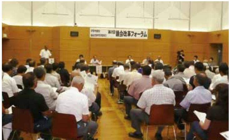
議会改革フォーラムの様子

今後も議会改革に向け、市民の皆様のご意見をお聞きしながら、全議員「丸」となっており、「市民に身近な開かれた議会、信頼され頼りにされる議会」を目指して活動していきたいと考えています。