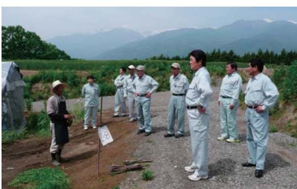
田原農業振興センター長の話しを伺う