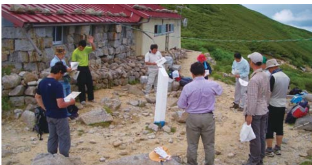
石室の前で説明を受ける委員

委員会は平成24年7月に西駒山荘の現地調査を行い、老朽化と中央アルプス北部への施設建設の必要性を再確認しました。その後、議員・山岳関係者との検討委員会を発足させ、登山者に喜ばれる山小屋建設に取り組み、方向付けを行いました。