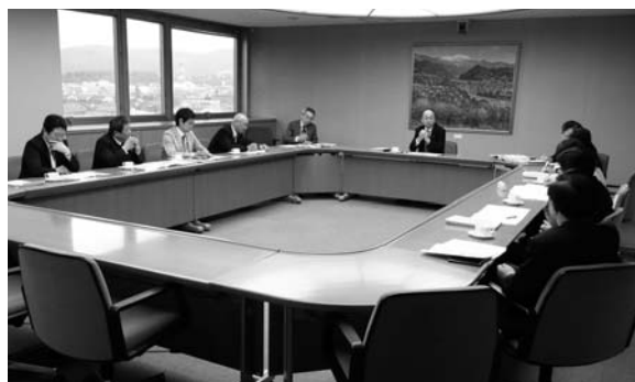
市長との懇談の様子

輪村で伊那市の人が正規採用になって行っている」「榛原河川公園を親子で気軽に遊べる公園に」と意見を述べ、市長からは「3歳未満児の保育園の待機児童解消については、既に指示を出している。保育士の確保については、臨時職員の待遇改善を考えている」と発言がありました。