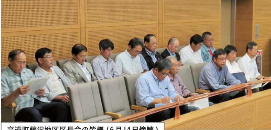
高遠町藤沢地区区長会の皆様 (6月14日傍聴)

定例会は、3月、6月、9月、12月に開会され、本会議のほかに各常任委員会が開催されます。一般質問では、議員と行政側との論戦が繰り広げられている場面を、また委員会では、各種議案(条例改正、予算・決算等)の審議状況を傍聴できます。