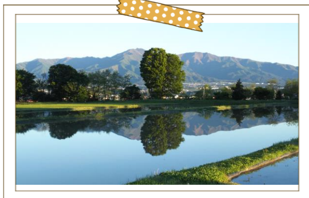
水かがみに映える山並み 地区から中央アルプスの山々が綺麗に見えます

三峰川より一段上がった地区で比較的小さな区です。歴史は古く在来の世帯が多いです。ナイスロード「竜東橋北」信号から車で2分程度で市内へのアクセスが良好です。