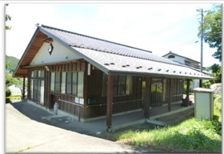
活動の拠点公民館