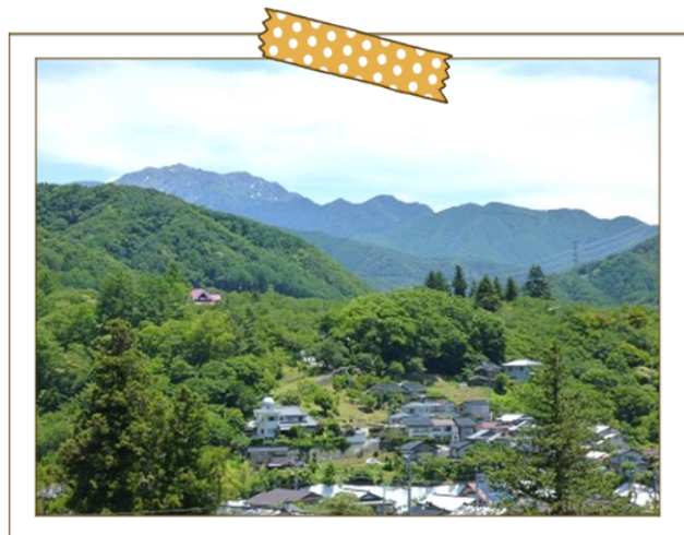
町内から高遠城址公園を望む

町内全体で毎年2回(春・秋)に親睦会(マレットゴルフなど)をしその後春は公民館、秋はさくらホテルで懇親会を楽しみます。