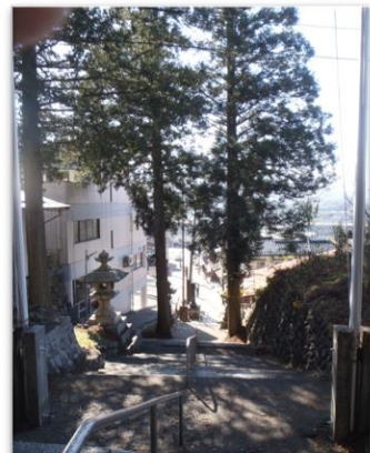
鉾 持 神 社 参 道