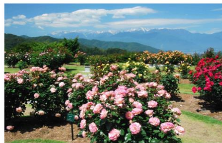
中央アルプスに映えるバラ

お困りごとは総代にお問い合わせください。住民の皆様と検討・相談していききたいと思います。