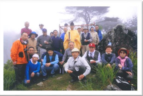
守屋山への健康登山