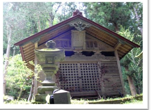
伊那市指定有形文化財のある五郎姫神社