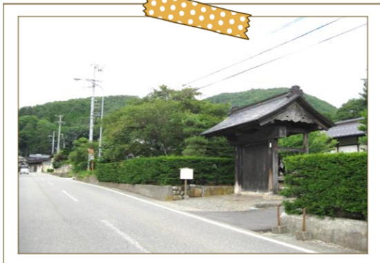
金沢(杖突)街道(伊那街道と甲州街道を結ぶ)と御堂垣外宿 本陣跡

中世から戦国初期には藤澤氏・保科氏の拠点(藤澤城跡)となっていた。特に保科氏(保科正俊・正直)は、ここを拠点に勢力を伸ばし保科正光(高遠城主)・保科正之(徳川家光の異母弟・会津藩主)と引き継がれていく。地区は歴史的価値のある藤沢城跡(蛇山)を、活性委員会を組織し守っている。また金沢(杖突)街道の御堂垣外宿として、江戸時代の参勤交代及び大名の宿のために、1681年から1684年に整備された。江戸と高遠を結ぶ歴史ある地区で現在も本陣跡(玄関・式台などは当時のまま)や問屋跡(伊勢屋・越後屋)があり当時の面影を残している。