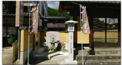
町内にあるお地蔵様