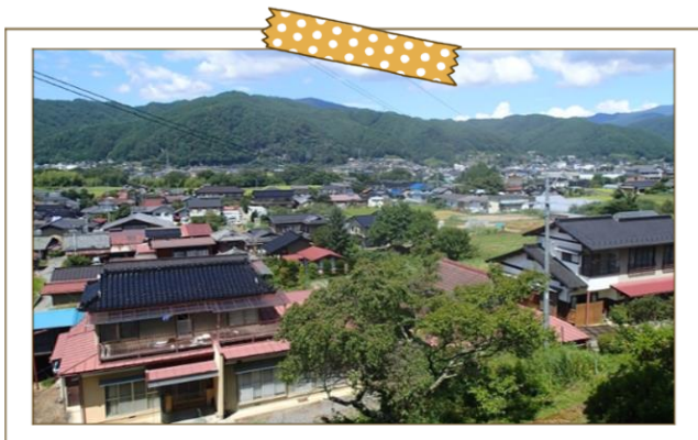
三峰川左岸の河岸段丘3段目には下山田の居住区があります。

地域の教科書は、地域の様子や行事、必要となる負担など、地域で暮らし始めるために知っておきたい情報を事前にお知らせすることを目的に作成しました。 縁あって同じ地域に住むことになった皆さまが、地域の住民として安心して暮らしが始められ、スムーズにコミュニティになじみ、ともにより地域を作っていく仲間になってほしい。そんな願いを込めて作成しています。 ようこそ！伊那市へ！