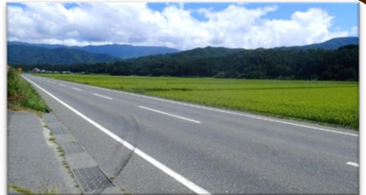
三峰川左岸の河岸段丘1段目に広がる 50haの田園地帯（景観形成住民協定地区）