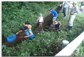
三峰川左岸の河岸段丘2段目の 伝兵衛井筋で魚取りを楽しむ小学生。