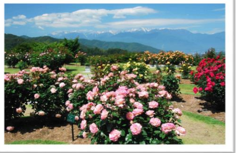
中 央 ア ル プ ス に 映 え る バ ラ