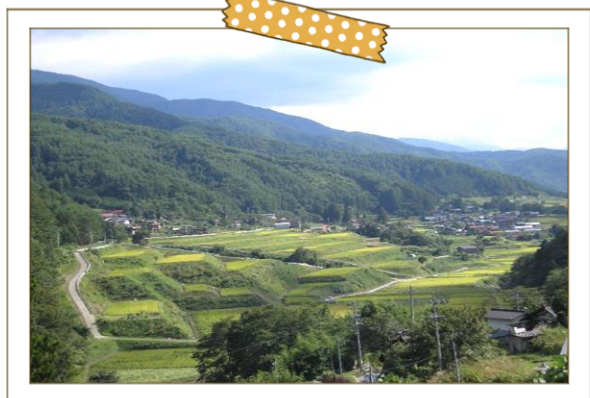
整備された棚田が美しい山室の里

高遠の町から15分、月蔵山のうらにあります。 近年、移住者が多くなり、子供の声が里山にひびき元気をもらっています。 移住者が多くなり、区に加入し、組や区の役員として参加してもらいます。 区民の安心安全に心がけ、まとまりのある区にしていきます。