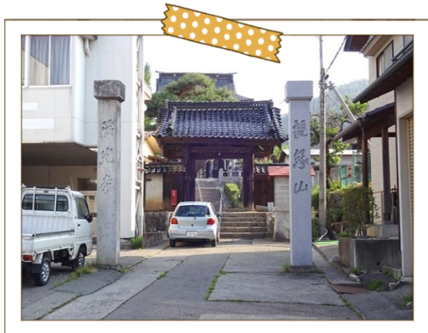
町内の風景（満光寺）

地域の教科書は、地域の様子や行事、必要となる負担など、地域で暮らし始めるために知っておきたい情報を事前にお知らせすることを目的に作成しました。