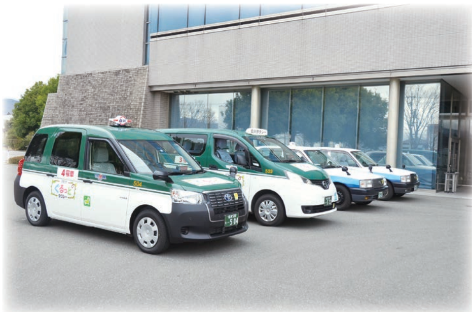
新たな公共交通としての役割が期待されるA1を活用した「ぐるっとタクシー」