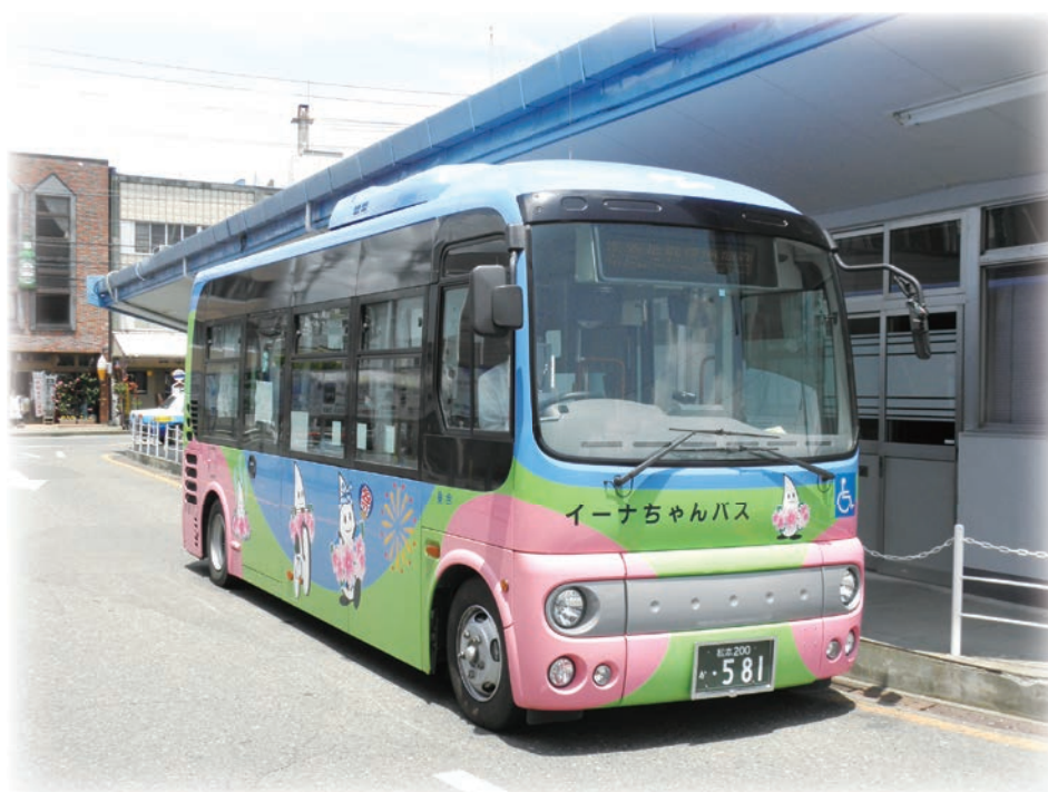
機能の維持に取り組む市街地循環バス「イーナちゃんバス」