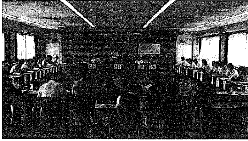
第2回協議会の様子(2008/8/27)