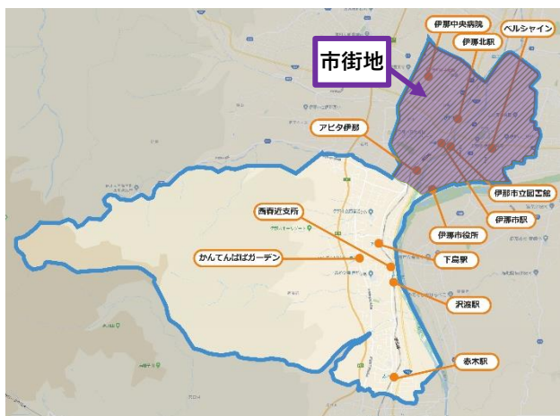
A地区の運行エリア(略図)