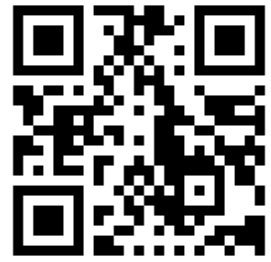
「伊那 MR スクエア」

※伊那市公式ホームページや伊那市移住定住応援サイトなどからアクセスできます。今後、関係機関サイトにバナー掲載等を行うほか移住セミナーや移住イベントチラシ等にも QR コードを掲載するなど多方面からアクセスできるようにします。