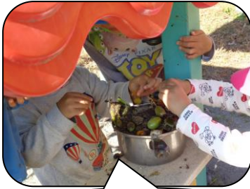
本物野菜でおままごと