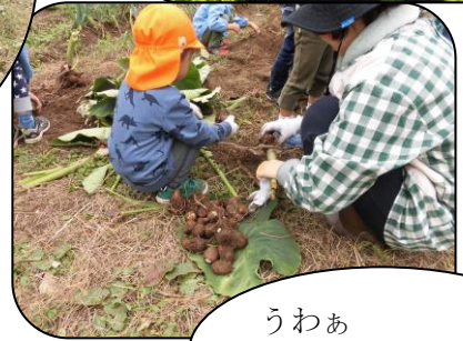
うわあ ピーナッツだあ