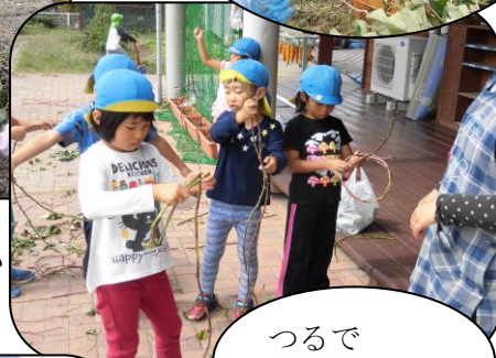
つるで リース作り