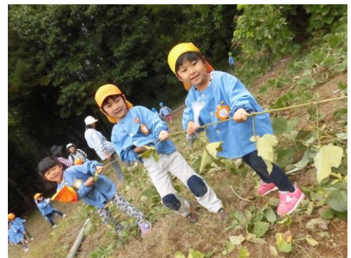
くずのツルで綱引き