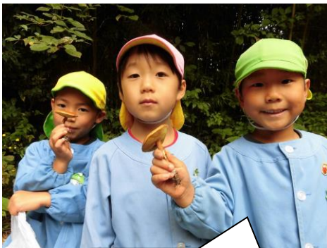
きのこみつけたよ!

秋の遠足は黒河内マレット場に行き、どんぐり・栗・キノコ・松ぼっくり・・・たくさんの秋を見つけて楽しみました。