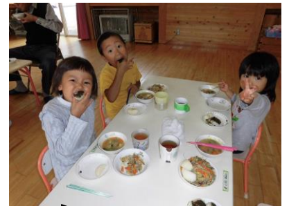
おいしくて いっぱい食べれそう...

地域運営委員の皆さんにお手伝いいただき、五平餅を作りました。年中、年長の園児が炊き上がったご飯をつぶして、丸めました。焼きあがってくると、いい匂いがしてきて、年少の園児も思わず見学・・・ホールでみんな一緒に美味しくいただきました。