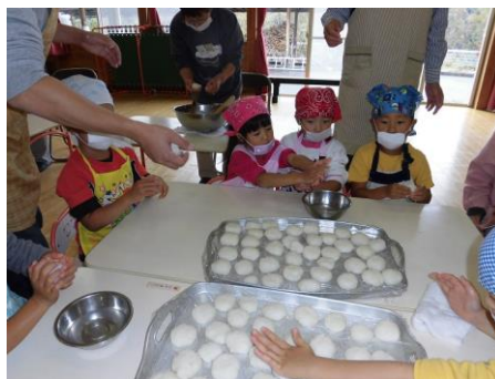
「手に水をつけるといいよ」 と教えてくれたよ。