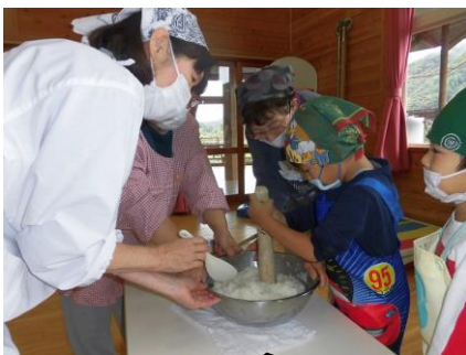
くっついちゃって、 むずかしいな〜