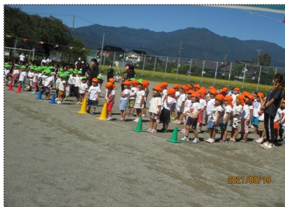
東春近小学校・校庭での本番