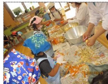
野菜を洗う・皮をむく・切る