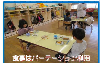
食事はパーティション利用

年明けからオミクロン株大流行。その影響は市内小中学校や保育園にも大きな影響が及んでいます。