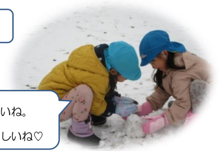
冷たいね。 でも楽しいね♡