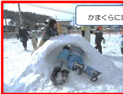
かまくらに窓も作ろう