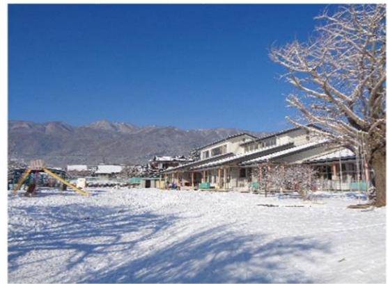
青空に白い雪**雪景色の園庭

今年の冬は何度か雪が積もり大好きな雪遊びが出来ました。西春近南保育園の築山は最高の「そりゲレンデ」です。未満見さんから年長さんまで、そりすべりを楽しみました。