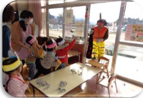
怖いけど頑張るぞ！「オニは～そと！」