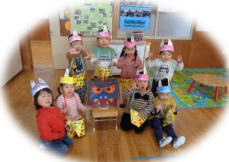
かわいい「子オニ」勢揃い。2歳児さんです