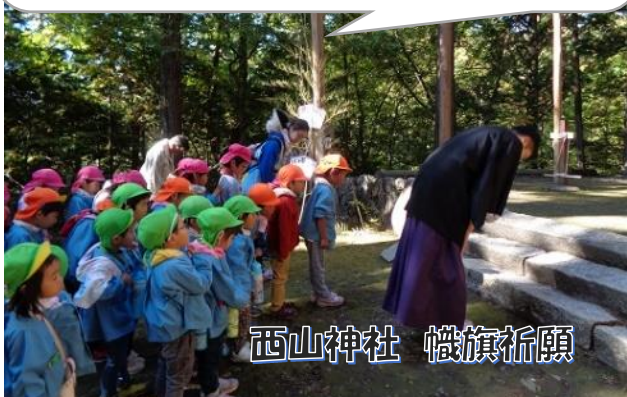
西山神社 幟旗祈願