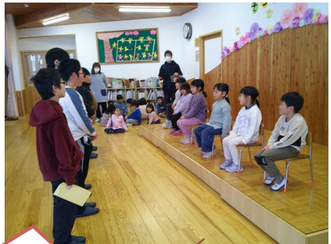
「〇〇さんと一緒に登校する〇〇です。」と自己紹介してくれました

四月から一年生になるひまわりさんのところに、新山小学校の五年生が「一年生を迎える会」の案内を持って訪ねてきてくれました。一緒に登校してくれるお兄さんやお姉さんの名前と顔がわかり、心強く感じています。入学した時には六年生になる皆さんです。よろしくお願いいたします。今年度も新山小学校の皆さんと、たくさんの交流をさせていただきました。ありがとうございました。