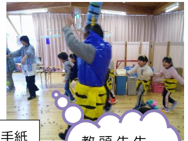
教頭先生も青鬼役で登場！

恒例の節分豆まきに、一年生が可愛い小鬼役で登場！！みんなで豆を投げて、心の中から思い思いの鬼を追い出しました。一年生との交流もほのぼのと温かい雰囲気嬉しいですね。