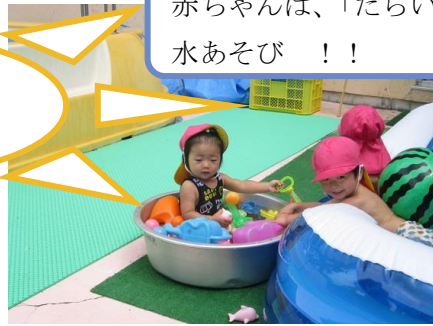
赤ちゃんは、「たらい」で水あそび !!