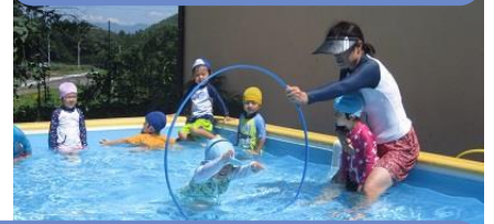
ビート板を使ったり、フラフープをくぐったり、ぐるぐる回って「洗濯機ごっこ」をしたり、先生に放り投げてもらって飛び込んだりして遊んでいます。

今年の夏は早くから暑く、いっぱいプール遊びが楽しめて、子どもたちの多くが、水となかよしになりました。中には潜って泳ぐ真似をするお友だちもいます。