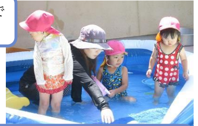
ひよこ組さんは、ちょっと大きめのビニールプールで遊びます。