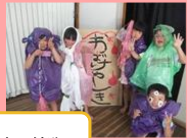
「おぼけやしき」だぞ～