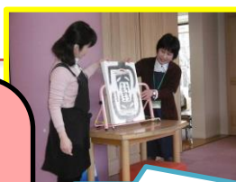
図書館で大型絵本を見ました。

今年も伊那の街まで「社会見学（体験）」に行ってきました。竜北保育園では、大人数のお友だちに混じって年齢毎にゲームやごっこ遊びで交流しました。次に伊那北駅から伊那市駅まで電車に乗り、そこから歩いて図書館に行きました。電車や図書館の中など公共の場所でのマナーを覚える、よい社会体験ができました。