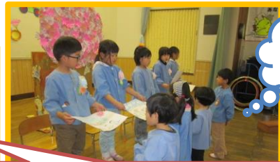
引き継ぎをします。廊下とリズム室の雑巾がけをして下さい。