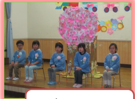
いっぱいあそんでくれて、ありがとう！

年中さんが中心になって、ひまわり組を送る「お別れ会」が行われました。司会進行も年中さん。大きな声で立派にできました。シンボルツリーの桜の木は沢山の桜の花に変わっていて、ステージが春らしく華やかになりました。