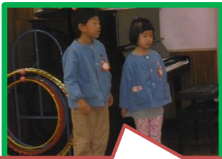
ひまわりさんが入場します。

年中さんが中心になって、ひまわり組を送る「お別れ会」が行われました。司会進行も年中さん。大きな声で立派にできました。シンボルツリーの桜の木は沢山の桜の花に変わっていて、ステージが春らしく華やかになりました。