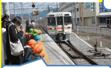
お～い、電車が来たよ～