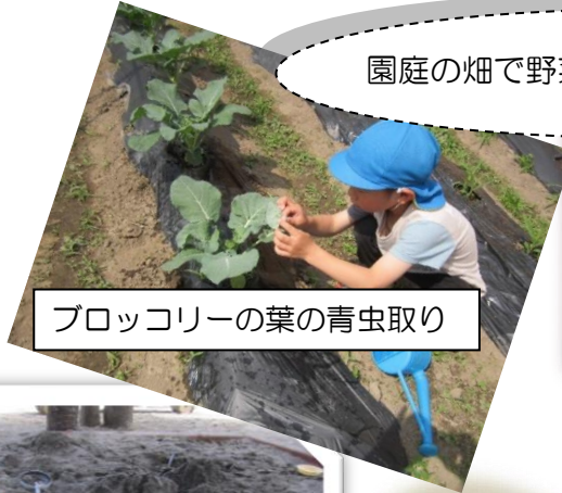
ブロッコリーの葉の青虫取り