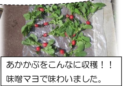
あかかぶをこんなに収穫！！ 味噌マヨで味わいました。