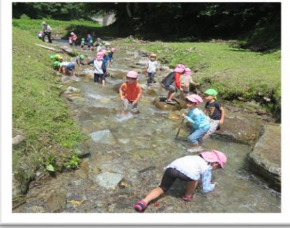
長谷保育園の年長さんと長谷の親水公園で交流

バスに乗ってお出かけすることは特別感があってウキウキワクワク♡初対面のお友だちともすぐに仲良くなって名前を呼び合い遊ぶ子ども達でした。開放感を味わいながら夏の自然を満喫してきました。