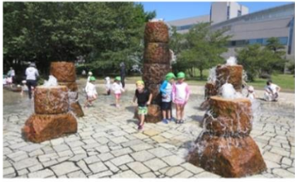
伊那保育園の年長さんと市役所せせらぎ水路で交流

バスに乗ってお出かけすることは特別感があってウキウキワクワク♡初対面のお友だちともすぐに仲良くなって名前を呼び合い遊ぶ子ども達でした。開放感を味わいながら夏の自然を満喫してきました。