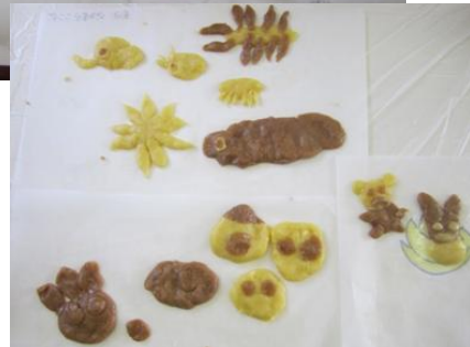
年少さんが作ったコロコロクッキー。