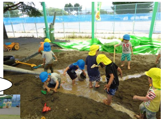
水を運び、みんなで協力して川作り