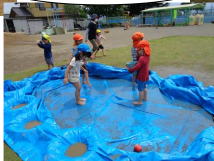
ブルーシートのプールの出来上がり