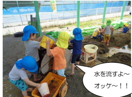
水を流すよ～ オッケ～！！