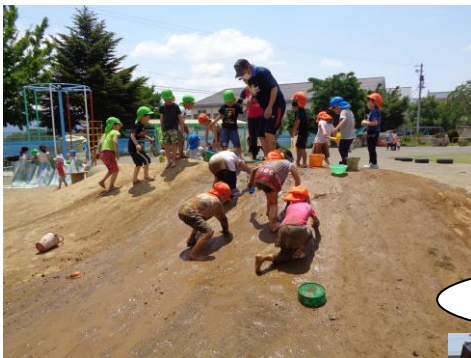
泥んこすべりスリル満点、楽しいね！