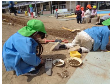
こちらは赤土山でお団子作り