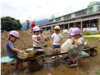
未満児さんが揃って食事会です