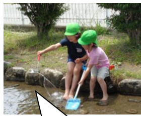
せせらぎで仲良しこよし