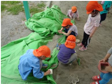
さらさら粉作りに全神経集中しています