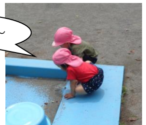
一番小さい お友だちも 虫に興味津々