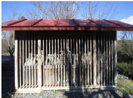
奈良尾いきいき交流施設の東側

奈良尾いきいき交流施設の脇に奈良尾十王堂があります。お堂は鉄骨造のトタン葺きです。本尊は地蔵菩薩坐像で、十王と呼ばれる仏像とその他数体がお堂の中に納められています。また、お堂の中には念仏用の大数珠も入っています。