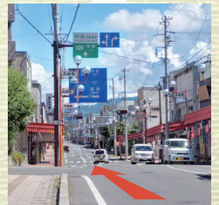
①通り町から伊那北方面に向かって進行します。

昭和33(1958)年、神子柴遺跡で行われた発掘調査において、局部磨製石斧(きよくぶませいせきふ)9点、打製石斧(だせいせきふ)4点、尖頭器(せんとうき)18点など、全部で87点の石器が出土しました。