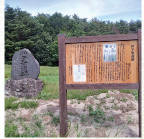
古代の人たちはこの丘に立ち、何を思い、何を祈って、このきわめて精緻な石器を集積したのでしょうか...