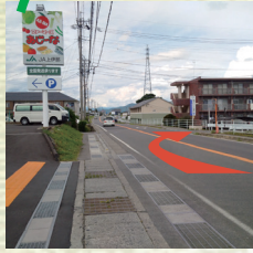
④JA上伊那ファーマーズあじーなの向いの道へ、右折。生活道路です。慎重に進んでください。