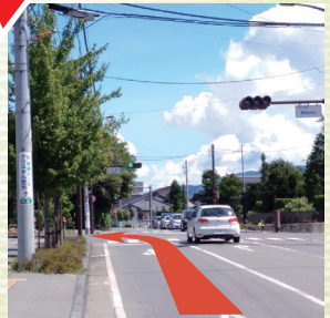
②御園の交差点を左折。伊那インターに向かってアクセス道路を登ります。