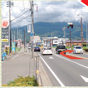
③駒美の交差点を右折。伊北方面へ、700mほど進みます。