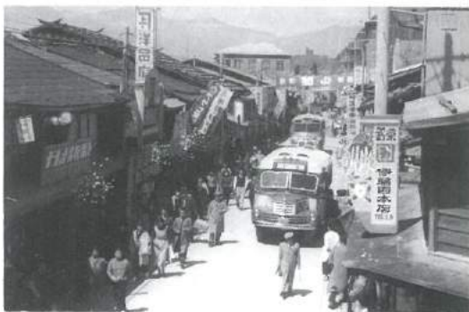
昭和30年代の本町通り