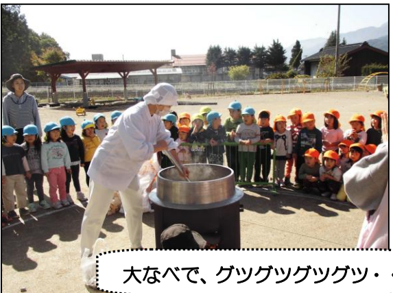
大なべで、グツグツグツグツ・・・