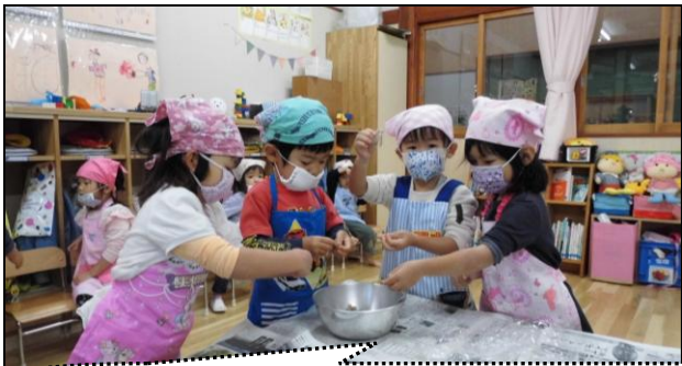
3歳児は、“野菜洗い”と“こんにやくちぎり”担当