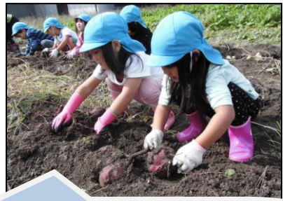
「おいも、あった～。つながってる～」

保育園では今年度も駐車場の隣の畑をお借りし、野菜作りをしました。春から秋にかけて5歳児を中心に草取りや水やりなどの世話をし、野菜が採れると洗って食べたり給食材料に使ったりしてきました。10月の中旬にはさつまいもを掘り自分たちの手で“さつまいも汁”を作りました。いつも遊ばせていただき、きのこ作りなどでも大変お世話になっている老松場の整備委員の皆様をお招きして会食をしました。