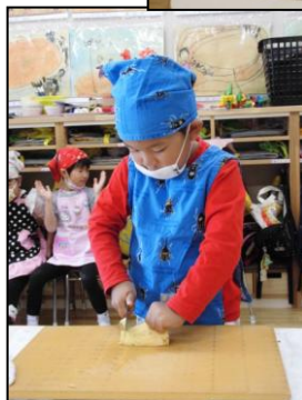
5歳児は“野菜切り”担当。手を切らないように“猫の手”をして、真剣です。