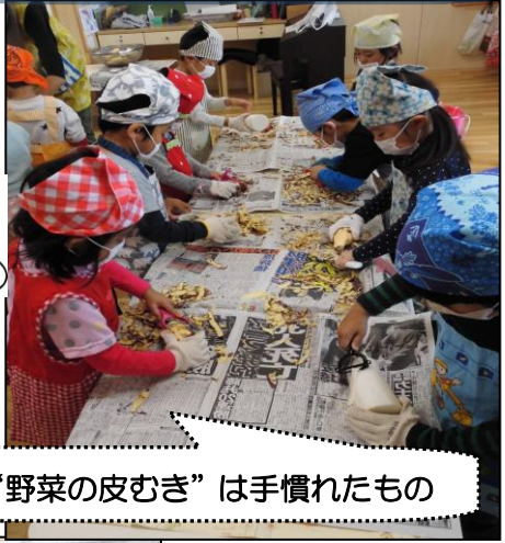
4歳児の“野菜の皮むき”は手慣れたもの