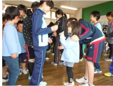
5年生とジャンケン列車