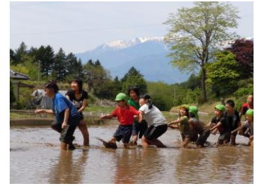
田んぼで綱引き そ〜れ!