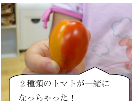
2種類のトマトと一緒に なっちゃった！