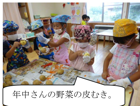
年中さんの野菜の皮むき。