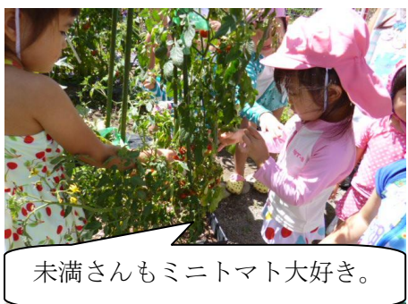
未満さんもミニトマト大好き。