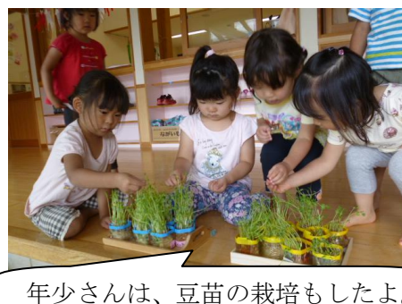
年少さんは、豆苗の栽培もしたよ。